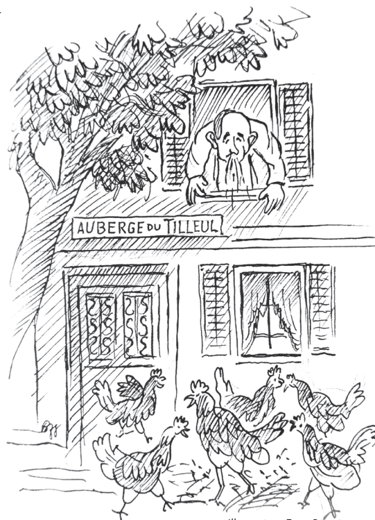
Illustration: Ernst Bänziger

Bücher mit vergnüglichen Kurzgeschichten und CDs im Kurzenberger Dialekt (Sprache des Appenzellerlandes über dem Bodensee) sind im Appenzeller Verlag erschienen und im Buchhandel sowie direkt bei www.peter-eggenberger.ch erhältlich.