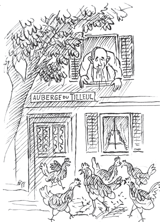
Illustration: Ernst Bänziger